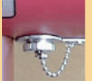
増設コネクター B-200Rと B-100Sのみ